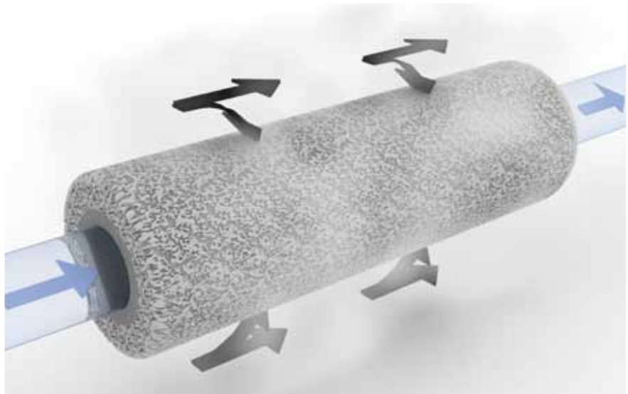
Reactorconcept dat bij MESA+ wordt bestudeerd om water katalytisch te zuiveren.

“Katalyse is ook zo’n typisch voorbeeld van de meerwaarde van nano-tech. Door het toevoegen van katalytische functionaliteit versnellen we een bestaande reactie. Of we maken een nieuwe reactie mogelijk, die voorheen niet bestond. Het gaat daarbij vaak om