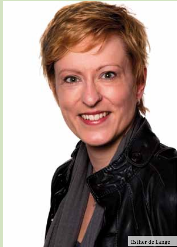
Esther de Lange

“Zeker. We hebben die rol al bij de aanpak van het klimaatprobleem; dat moet ook bij biodiversiteit gebeuren. Met Natura 2000 hebben we al een uniek instrument ontwikkeld. Maar inderdaad, de EU moet de boel wereldwijd lostrekken. Dat betekent bijvoorbeeld dat we niet alleen milieuministers moeten afvaardigen naar internationale conferenties, maar ook hun collega's van economische zaken. Het onderwerp moet breed gedragen worden. Uiteindelijk moet de overheid haar rol overdragen aan de consumenten, die zelf moeten gaan betalen voor behoud van biodiversiteit.”