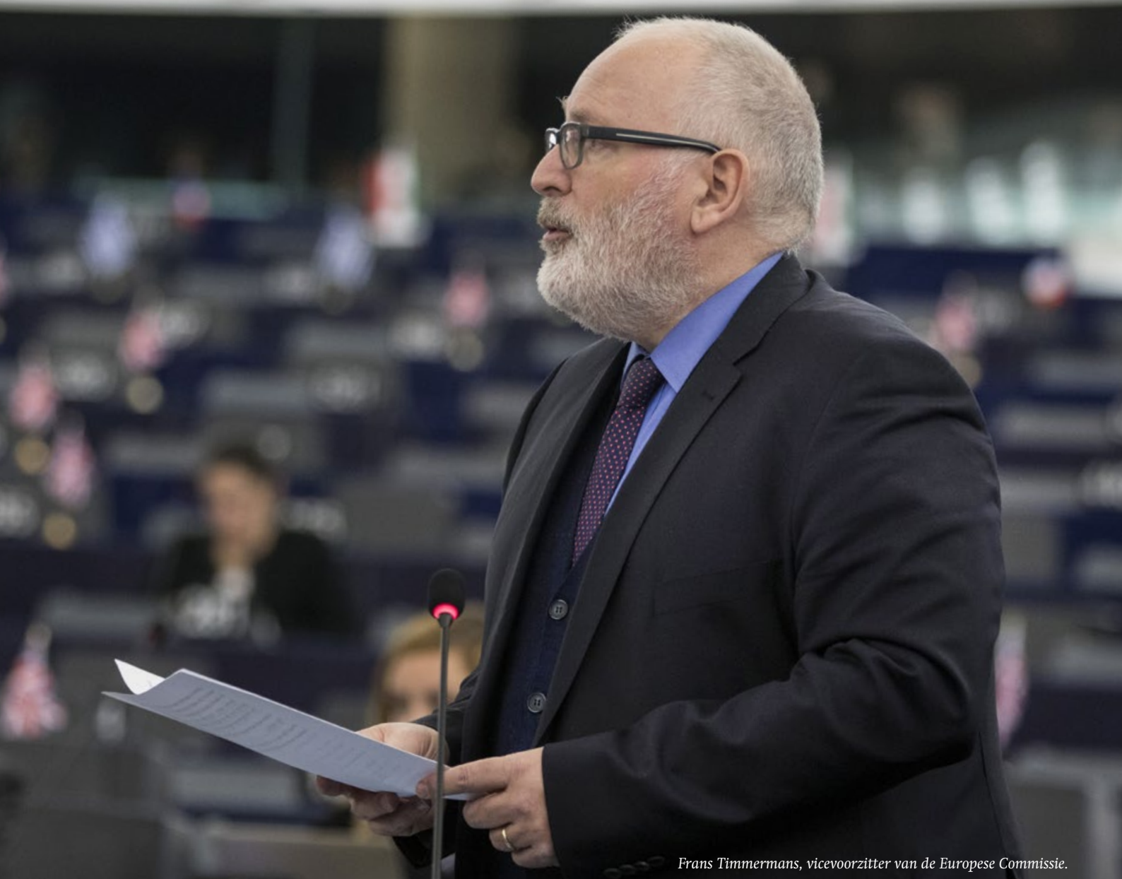
Frans Timmermans, vicevoorzitter van de Europese Commissie.

Eurocommissaris Timmermans presenteert Drinkwaterrichtlijn