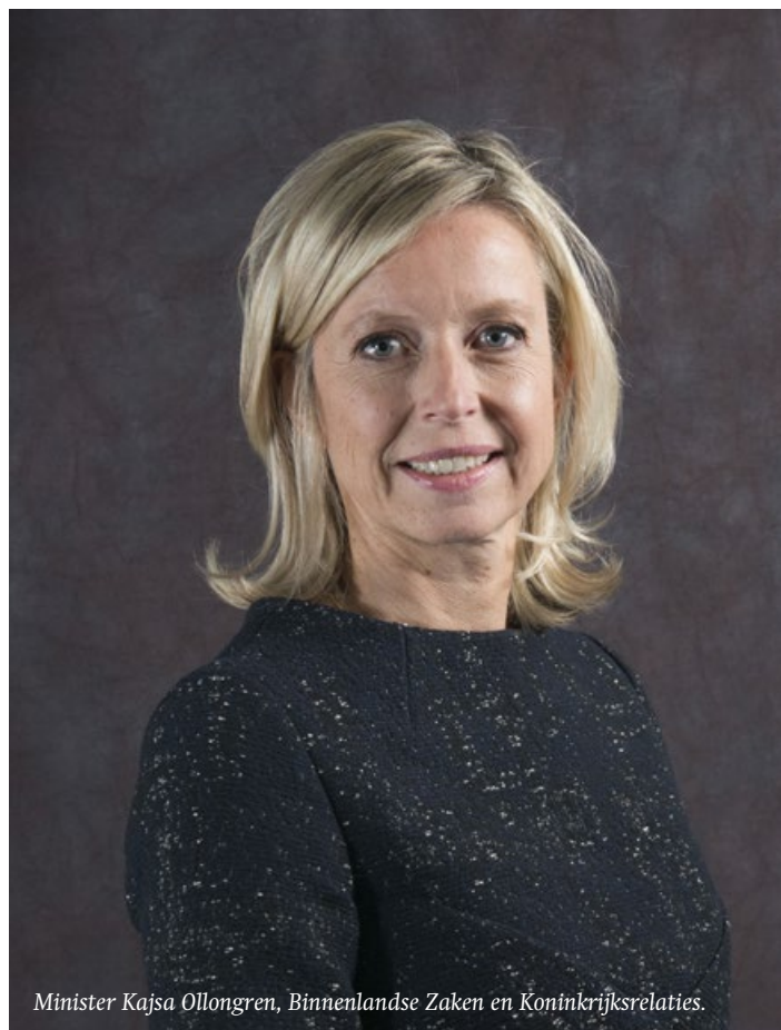
Minister Kaja Ollongren, Binnenlandse Zaken en Koninkrijksrelaties.

De drinkwatervoorziening is een publieke, wettelijke taak met een zorgplicht voor de overheid. Hierbij hoort ook uitwerking in de vorm van nationale bescherming voor de lange termijn. Overheden zijn verantwoordelijk voor de kwaliteit van de bronnen voor de drinkwatervoorziening. Op grond van de Omgevingswet worden meer bevoegdheden gedecentraliseerd. Bescherming van de drinkwatervoorziening op nationaal niveau moet ook doorwerken in de provinciale en gemeentelijke omgevingsvisies. Het drinkwaterbelang dient vroegtijdig in planvorming of vergunningverlening te worden betrokken, op nationaal en decentraal niveau.